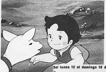
Un conjunto de pequeños animalitos acompañados, uno de ellos es...

Informe sobre un mito sorprendente HEIDI MAS ALLA DE LOS NIÑOS