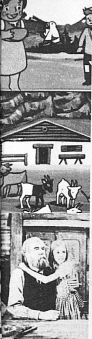
Chael Redgrave y Jennifer Edwards, tío y nieta de la última versión cinematográfica de Heidi.