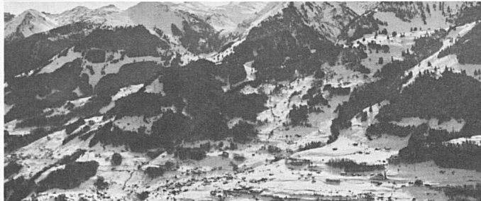
Filzbach mit Mürtschenstock

ca. 500 Fremdenbetten in Hotels, Restaurants, Ferienhaus, Sportzentrum und Privathäusern; erschlossenes Skigebiet mit einer Höhendifferenz von 1000 Metern; Sesselbahn und Skilifts, mechanisch präparierte Abfahrtspisten; verschiedene Schlittelabfahrten; ca. 8 km präparierte Langlaufloipe in wunderschönem und geeignetem Gelände