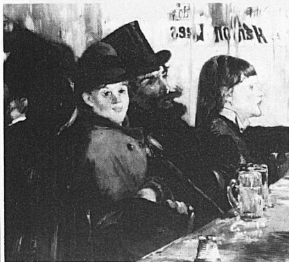
Edouard Manet «Au café», 1878