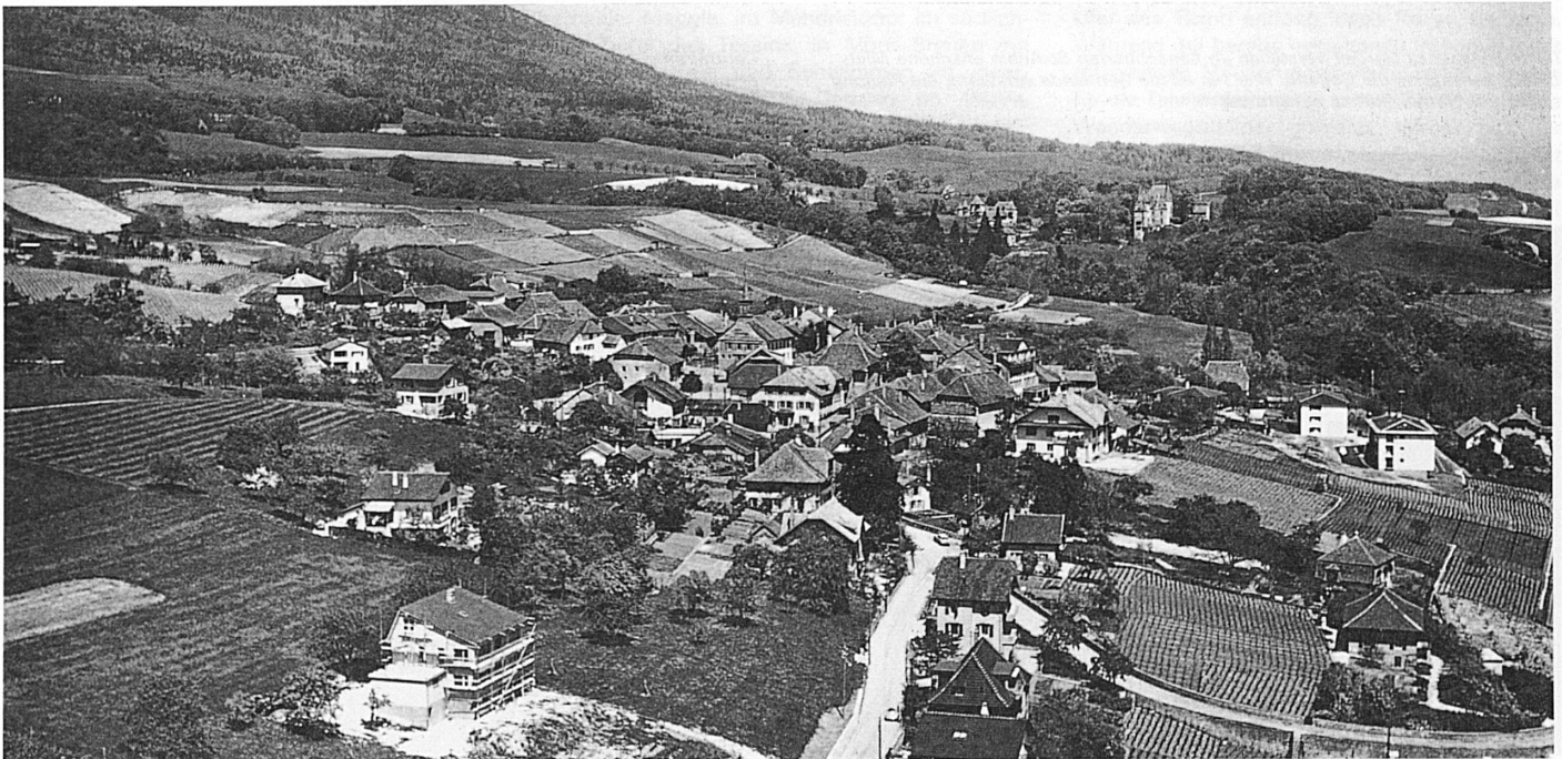
La zone protégée s'étend à l'arrière-plan de Gorgier. Les autres zones sont nettement réparties entre le vignoble, l'industrie, les villas et les maisons locatives, selon un plan fixe d'utilisation