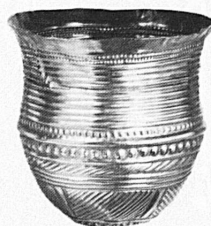
Goldbecher aus Eschenz TG Um 1700 v. Chr.

Spezialgeschäft für Frei- und Kabelleitungen jeder Art Schwebebahnen Trolleybus- und Bahnleitungen