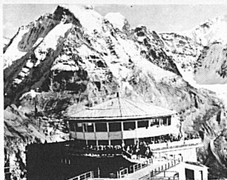
Drehrestaurant Piz Gloria