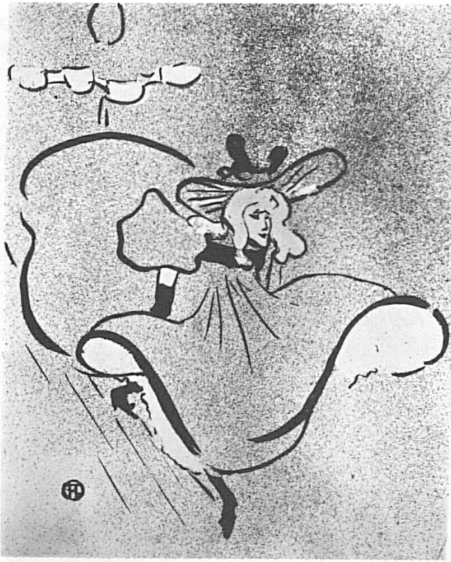
Henri de Toulouse-Lautrec, Jane Avril, Lithographie 1893