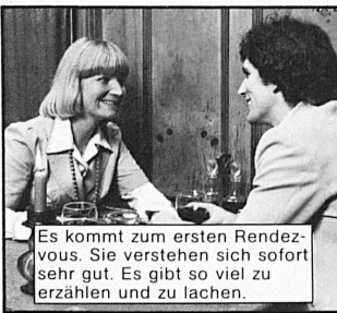
Es kommt zum ersten Rendez-vous. Sie verstehen sich sofort sehr gut. Es gibt so viel zu erzählen und zu lachen.