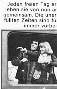
Jeden freien Tag erleben sie von nun an gemeinsam. Die unerfüllten Zeiten sind für immer vorbei.