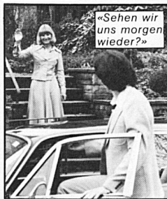
«Sehen wir uns morgen wieder?»