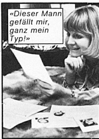
«Dieser Mann gefällt mir, ganz mein Typ!»