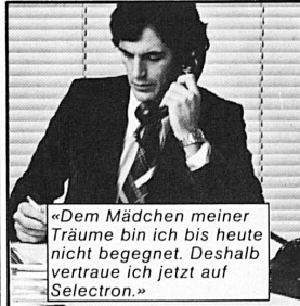
«Dem Mädchen meiner Träume bin ich bis heute nicht begegnet. Deshalb vertraue ich jetzt auf Selectron.»