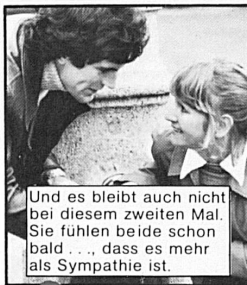
Und es bleibt auch nicht bei diesem zweiten Mal. Sie fühlen beide schon bald ... dass es mehr als Sympathie ist.