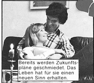
Bereits werden Zukunftspläne geschmiedet. Das Leben hat für sie einen neuen Sinn erhalten.