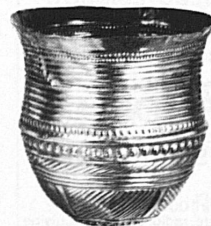
Goldbecher aus Eschenz TG Um 1700 v. Chr.