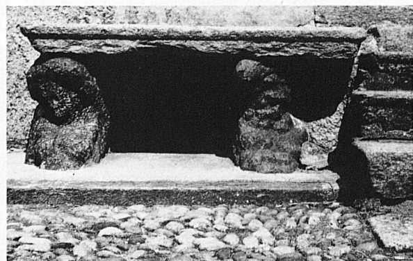
Wohl aus dem 17. Jahrhundert stammen die Atlantenhalbfiguren der granitnen Bank vor dem Hause der Brunoni

Un tempo sulla vita di Golino incideva profondamente la presenza religiosa e la chiesa parrocchiale di S. Giorgio fu a lungo il centro di tutta la vicinanza di Intragna, alla quale la famiglia Modini di Golino diede numerosi teologi influenti. Così, Carlo Giuseppe, nato nel 1655, assurse al rango di protonotario apostolico e di Cavaliere dell'ordine dello Sprone