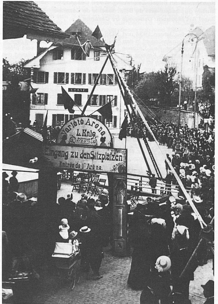
1909 in Lenzburg