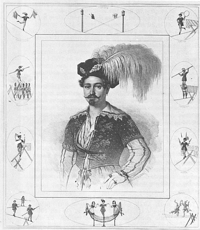
2. Generation: Rudolf Knie, 1808–1858