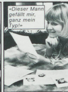
«Dieser Mann gefällt mir, ganz mein Typ!»