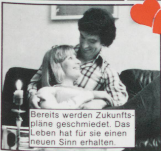
Bereits werden Zukunftspläne geschmiedet. Das Leben hat für sie einen neuen Sinn erhalten.