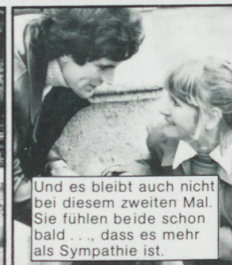
Und es bleibt auch nicht bei diesem zweiten Mal. Sie fühlen beide schon bald ... dass es mehr als Sympathie ist.