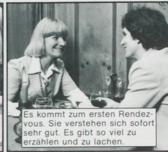
Es kommt zum ersten Rendez-vous. Sie verstehen sich sofort sehr gut. Es gibt so viel zu erzählen und zu lachen.