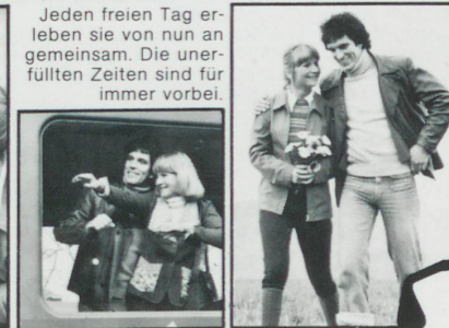
Jeden freien Tag erleben sie von nun an gemeinsam. Die unerfüllten Zeiten sind für immer vorbei.