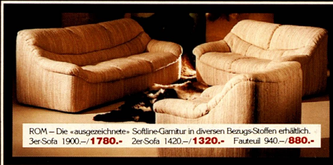
ROM – Die «ausgezeichnete» Softline-Garnitur in diversen Bezugs-Stoffen erhältlich. 3er-Sofa 1900.-/ 1780.- 2er-Sofa 1420.-/ 1320.- Fauteuil 940.-/ 880.-