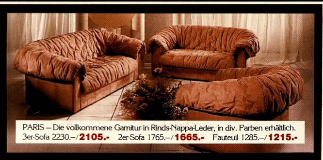
PARIS – Die vollkommene Garnitur in Rinds-Nappa-Leder, in div. Farben erhältlich. 3er-Sofa 2230.-/ 2105.- 2er-Sofa 1765.-/ 1665.- Fauteuil 1285.-/ 1215.-