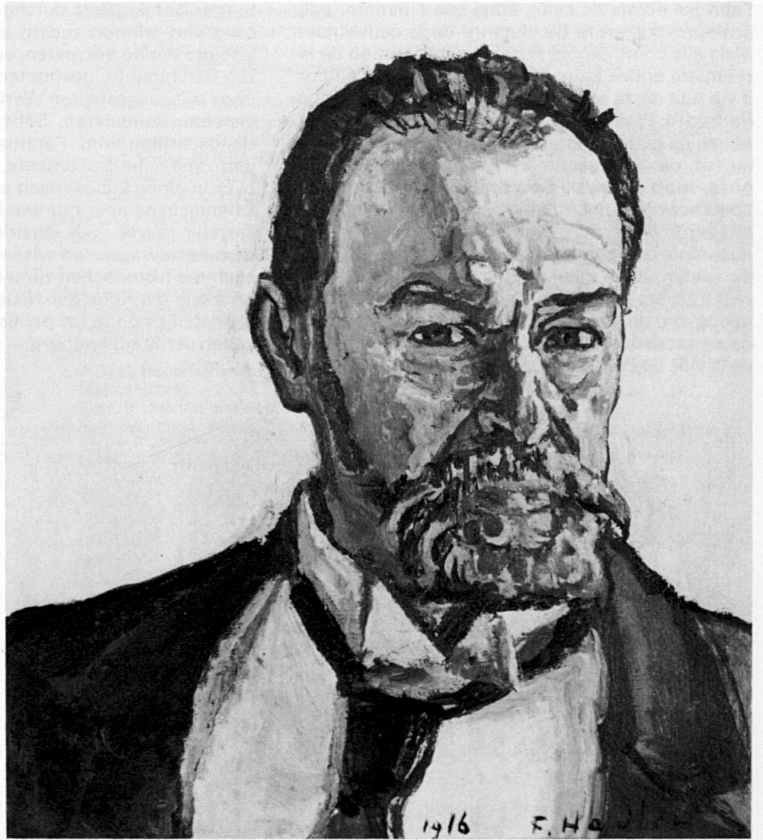
Selbstbildnis 1916. Musée d'art et d'histoire, Genève