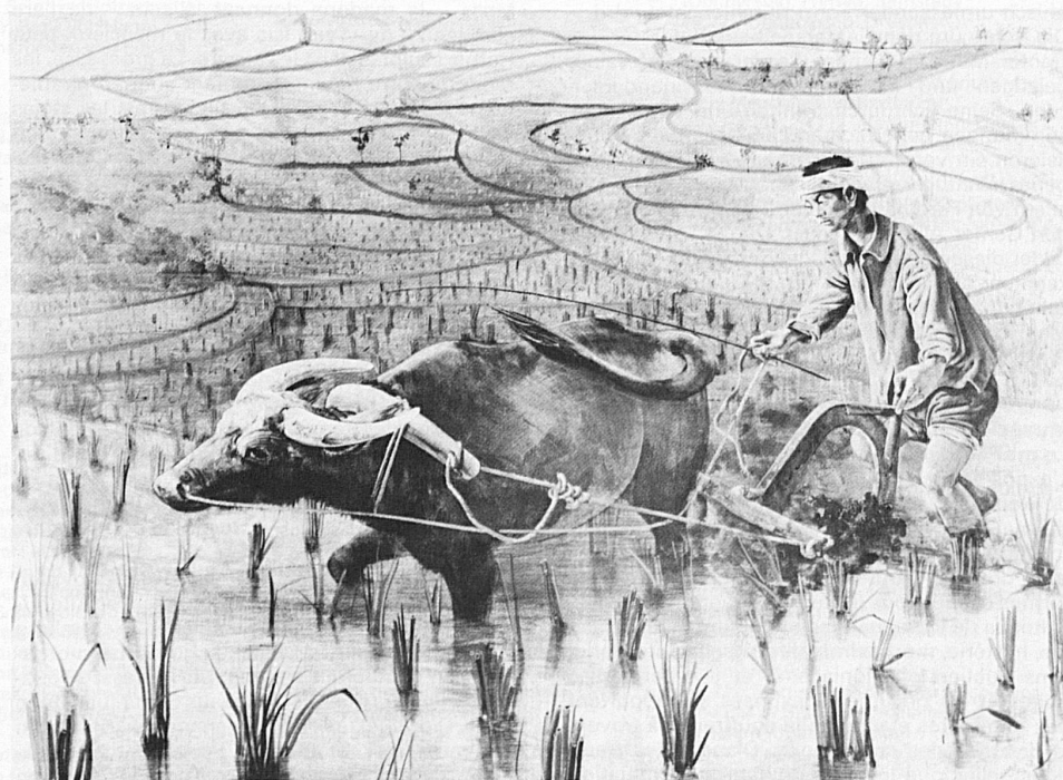
Begegnung in China: «Pflügen im Reisfeld», von Hans Erni (Acryl, 143 × 202 cm)

Die Ausstellung «Begegnung in China» umfasst gegen 100 Werke, unter anderem Tusche- und Temperabilder, der chinesischen Landschaftsmalerin Fu Yi-Yao und von Hans Erni, der eigens dafür auch einige extrem quer- und hochformatige Bilder schuf, wie sie für die chinesische Malerei charakteristisch sind. Vor einem Jahr hielt sich Hans Erni in China auf. Sein Erleben fand Niederschlag in einer Reihe von Werken, die nun, zusammen mit Bildern der chinesischen Künstlerin, vorgestellt werden. Ergänzt wird die Ausstellung durch einige Leihgaben des Museums Rietberg in Zürich. Bis 31. Mai