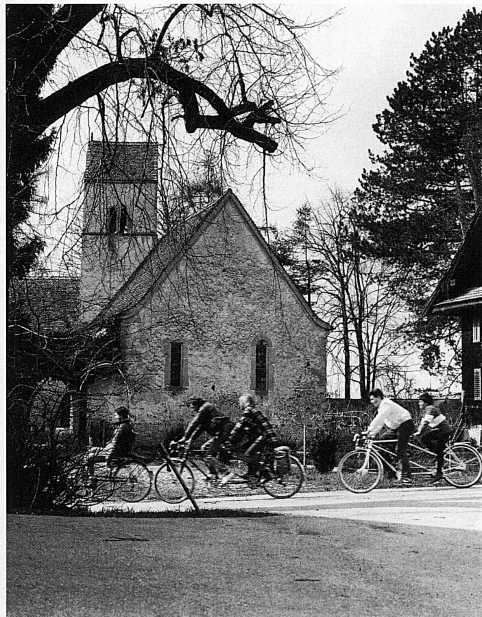
59 Beim «Schloss» in Beromünster / Au pied du «Château» à Beromünster 59 Presso il «Castello» a Beromünster / Passing the castle in Beromünster