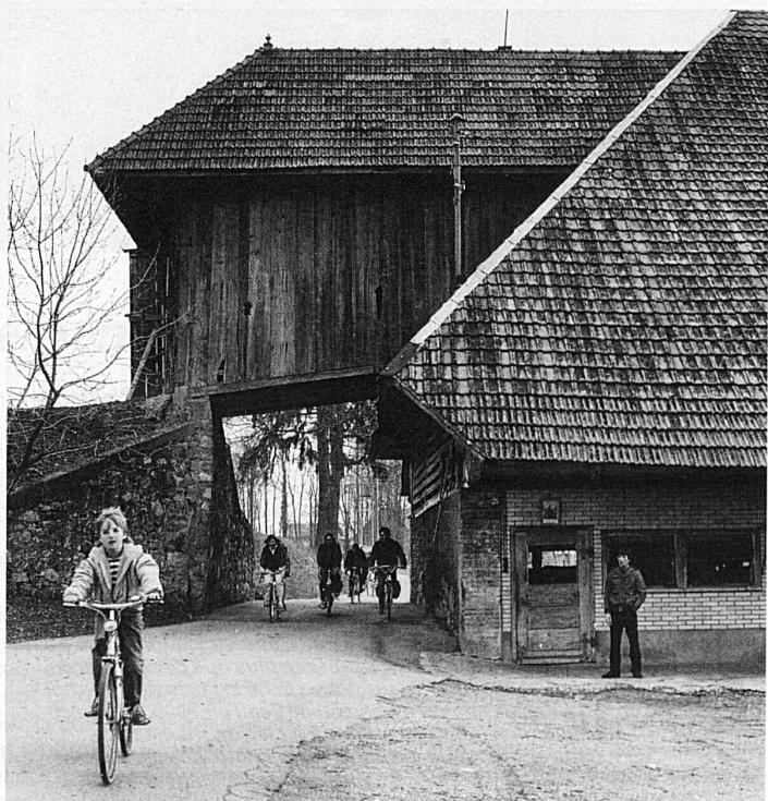
62 Fahrt durch Weiler und Dörfer / A travers hameaux et villages 62 In viaggio attraverso casali e villaggi / The route through small villages