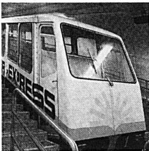
SUNNEGGA-EXPRESS die 1. Alpenmetro

15 Autominuten von Sitten (Rhonetal). ANZERE bietet Ihnen diesen Sommer • 40 Kilometer Wanderwege • Animationen für Kinder • Reiten - Tennis - Bergsteigen - Schwimmbad • Botanischer Weg • Wohnungen, Chalets - Vermietungen und Hotels 18.7. Wettlauf auf der Alm • 18./19.7. Ochsenfest • 25./26.7. Internationales Automobilbergrennen Ayent-Anzère • 8.8. Mountain-Bike-Rennen • 14.9. Mitsommerfest. Verkehrsbüro, 1972 Anzère, Telefon 027 38 25 19