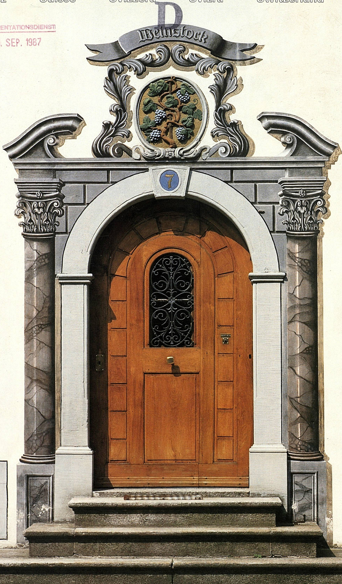
SCHERBHAUS DURCH DIE M 1976 RESTAUR SCHUTZ DER EIDGENOSSEN