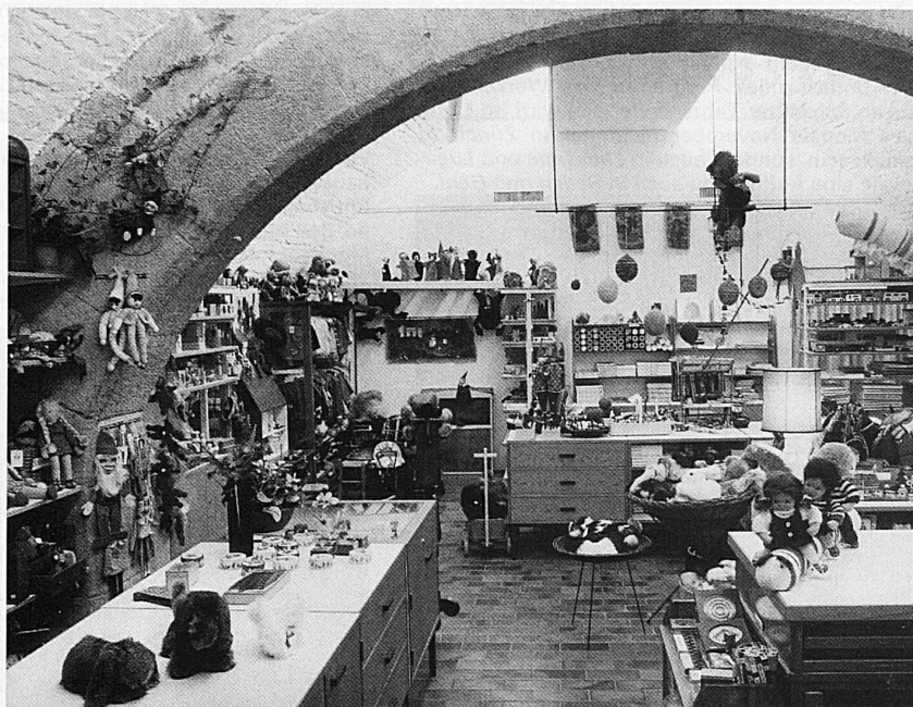
Die verschiedenen Verkaufsstellen des Heimatwerks sind bemüht, Kunsthandwerk in einer angepassten Ambiance zu präsentieren (links: Schweizer Heimatwerk St. Gallen, oben: das selbständige Oberländer Heimatwerk in Bern)