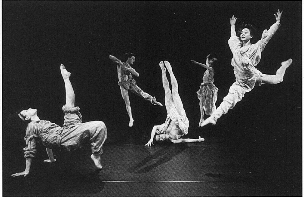
Die Gruppe der Movers gab ihren Einstand am Tanznovember 1986 und hat seither zahlreiche Zuschauer erfreut.

Karten für die Vorstellungen: Billet-Zentrale Zürich und Musikhaus Hug. Hinweise auf die Vorstellungen in der Romandie und im Tessin im untenstehenden Beitrag.