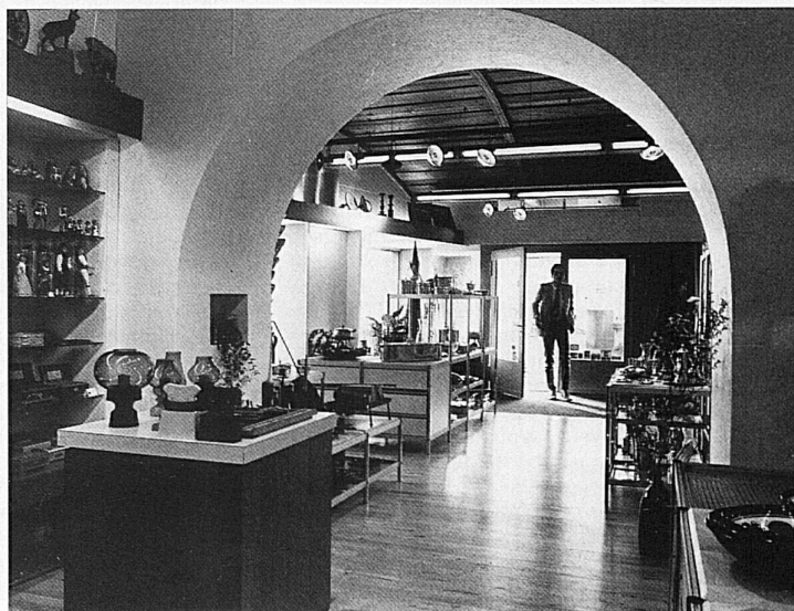
Innenaufnahme des Heimatwerks Zürich