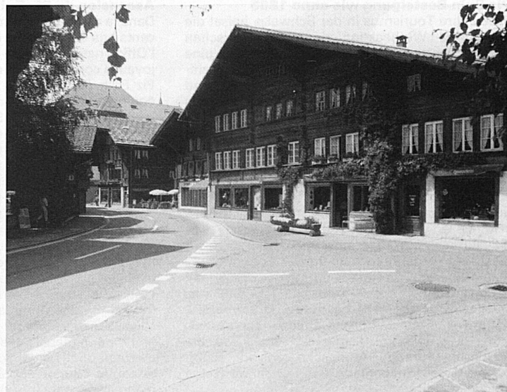
Die Hausweberei Saaen, ein selbständiges Heimatwerk im Berner Oberland