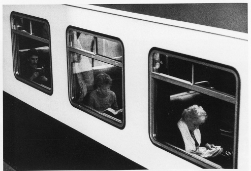
16-18 En train de Berne à Schwarzenburg. Quand, en 1803, la ville de Berne se vit attribuer définitivement la seigneurie de Schwarzenburg, elle assumait l'obligation de rattacher le nouveau district plus étroitement au reste du canton. Dès 1824 une route carrossable relia Schwarzenburg à Berne; en 1831 un pont de pierre remplaça le vieux pont de bois au-dessus de l'Eau-Noire. A partir de 1841 une diligence postale assurait trois fois par semaine la liaison avec la ville, puis quotidiennement à partir de 1847. En 1882 un pont de fer permit d'éviter la descente malaisée dans la gorge de l'Eau-Noire. Enfin le 31 mai 1907 le premier train à vapeur circula sur la ligne de Schwarzenburg