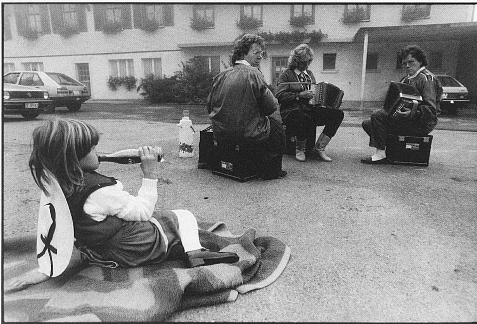
12–15 Alpabzug über Sangernboden nach Schwarzenburg