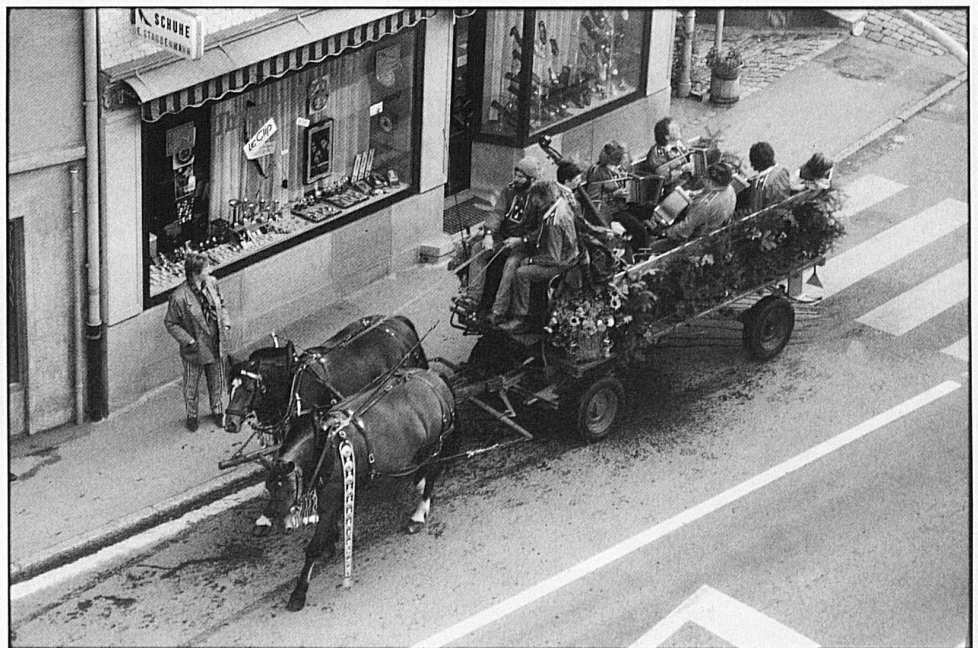
12-15 A procession from the alp passing from Sangernboden to Schwarzenburg