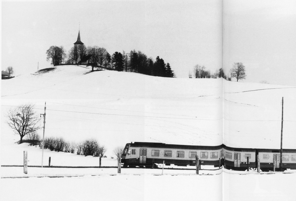
16-18 Im Zug von Bern nach Schwarzenburg. Als 1803 die Herrschaft Schwarzenburg endgültig zu Bern kam, erkannte die Aarstadt ihre Verpflichtung, den neuen Amtsbezirk enger mit dem übrigen Kantonsgebiet zu verknüpfen. Seit 1824 konnte die Strasse Bern-Schwarzenburg durchgehend mit Fuhrwerken befahren werden. 1831 ersetzte eine steinerne Brücke die alte Holzbrücke über das Schwarzwasser. Seit 1841 stellte eine Postkutsche die Verbindung nach der Hauptstadt her. 1882 machte eine asseme Höhebrücke den beschwerlichen Weg in den Schwarzwassergaben hinunter überflüssig. Am 31. Mai 1907 schliesslich erreichte der erste Dampfzug der langersehnten Linie Schwarzenburg