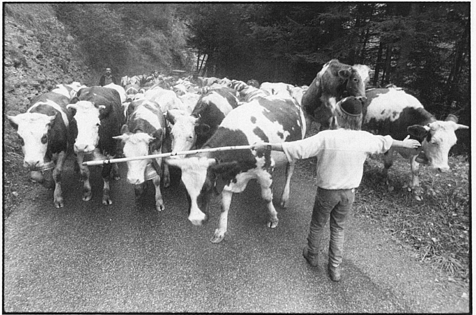
12-15 Il bestiame scende dall'alpe presso Sangernboden e attraversa Schwarzenburg