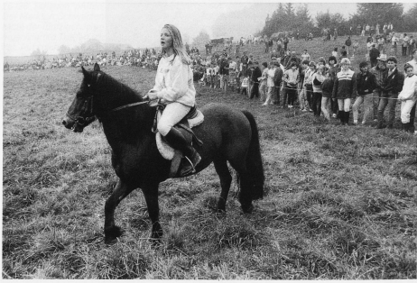
29-32 Alljährlich am ersten Oktobersonntag findet in Schwarzenburg das Bauernpferdrennen statt. Als besondere Attraktion gelten das Brücken- und Milchwagenrennen, das Trabennen mit zweirädrigem Gespann und das Rennen der Jugendlichen auf Freibergern