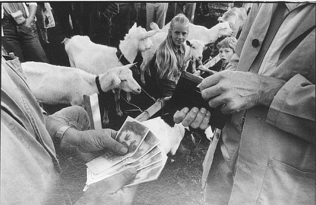
36-41 Ambiance de marché à Riffenmatt où, de bonne heure le matin, a lieu le tri des moutons revenus de l'alpage et restitués à leurs propriétaires