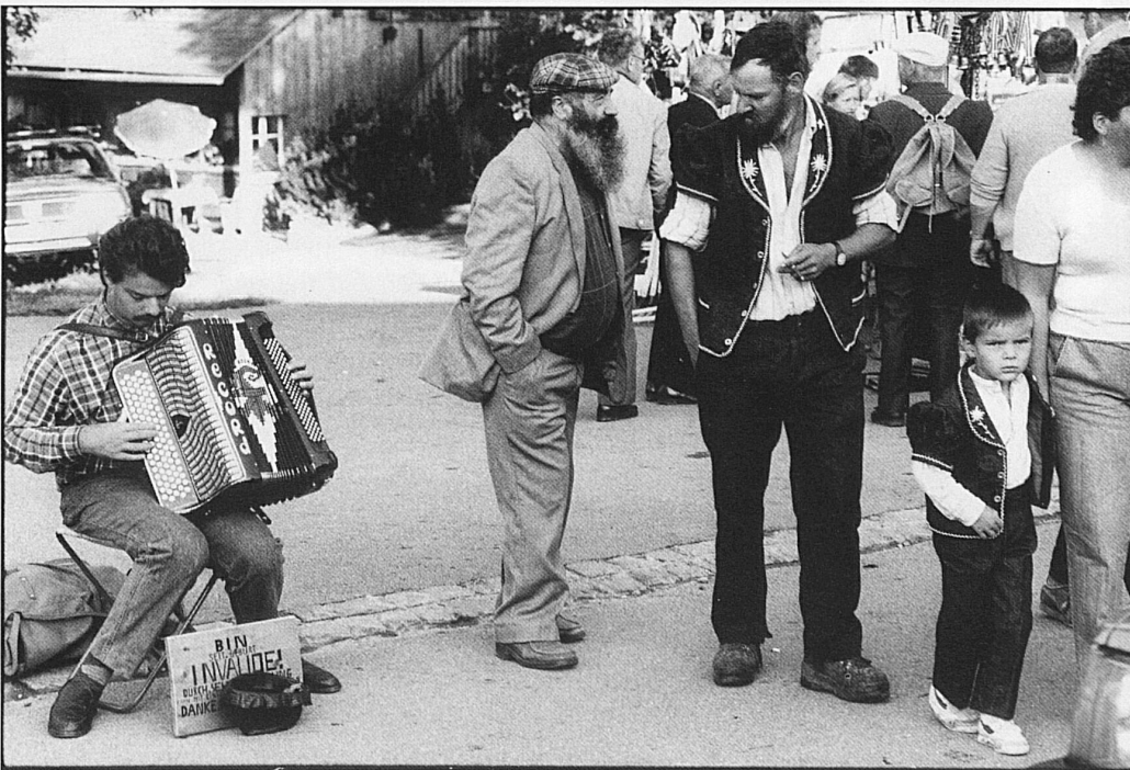
36-41 Marktstimmung in Riffenmatt, wo in der Früh die von der Sömmerrungsalp zurückkehrenden Schafe geschieden, das heisst ihrem Besitzer zugeführt werden