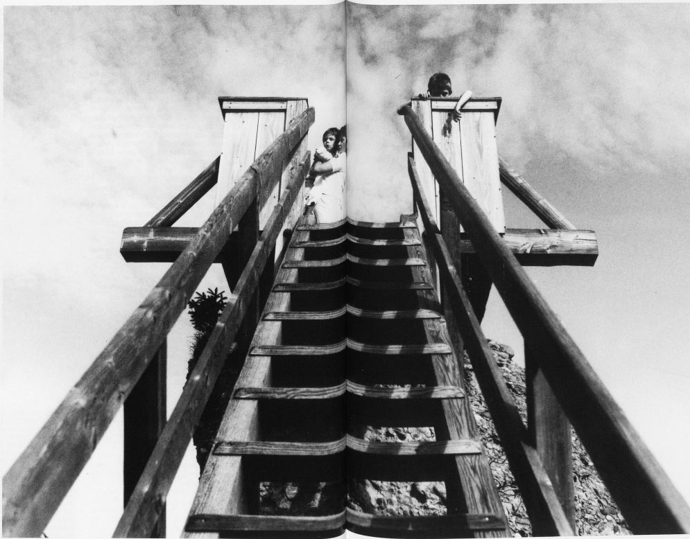
52 Aussichtspunkt Guggershörnli, 1283 m ü. M. Eine hölzerne Treppe von etwa 15 m Länge führt zu diesem Aussichtspunkt, der einer der schönsten im Bernerland und in dem nach der Tipperary-Melodie gesungenen Lied «S'isch a wyrtle Wäg uf's Guggershörnli» verewigt ist. Die Treppe wurde erstmals 1829 durch den «Sternen»-Wirt gebaut – eine Pioniertat für den Tourismus der Region. 53 Folgende Doppelseite: Sicht vom Guggershörnli Richtung Süd auf das Ganttrischgebirge 52 Point de vue du Guggershörnli (1283 m). Un escalier de bois d'une quinzaine de mètres conduit à ce point de vue, un des plus beaux du canton qu'immortalise une chanson populaire sur l'air de «Tipperary». L'escalier a été construit en 1829 par l'aubergiste Blaser, qui a rendu ainsi un éminent service au tourisme de la région. 53 Vue depuis le Guggershörnli en direction du sud sur le massif du Ganttrisch

Die Guggershörnli sind eine der schönsten Aussichtspunkte im Berner Oberland. Sie sind ein Wahrzeichen der Region und werden von den Einheimischen sehr geschätzt. Die Treppe wurde im Jahr 1829 erbaut und ist heute ein beliebtes Ziel für Touristen. Die Treppe führt von der Guggershörnli zum Ganttrischgebirge. Die Treppe ist aus Holz und hat eine Länge von etwa 15 Metern. Die Treppe ist ein Wahrzeichen der Region und wird von den Einheimischen sehr geschätzt. Die Treppe wurde im Jahr 1829 erbaut und ist heute ein beliebtes Ziel für Touristen. Die Treppe führt von der Guggershörnli zum Ganttrischgebirge. Die Treppe ist aus Holz und hat eine Länge von etwa 15 Metern.