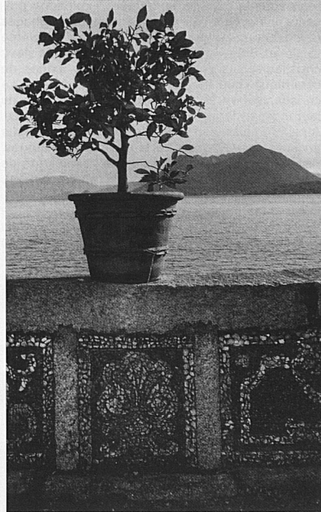
Jardins – itinéraires de plaisir: Isola Bella, Lago Maggiore

collectives, sans oublier les possibilités de vaincre le dépaysement de l'homme d'aujourd'hui. Depuis octobre 1982 ces artistes, qui se désignent eux-mêmes comme des amateurs, ont élaboré des tableaux avec leurs croquis, photos et plans. Ils ont été exposés avec un grand succès dans une galerie de Stockholm. A Lausanne, cette exposition s'accompagne de nombreuses manifestations ayant pour thème «le jardin». Jusqu'au 21 août