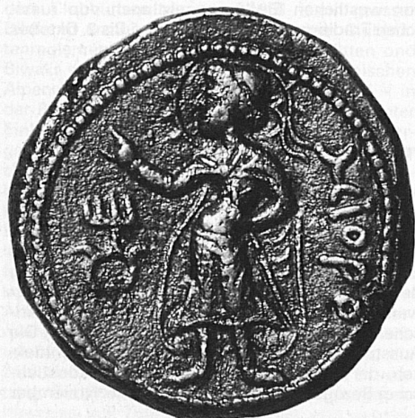
Münze eines Kuschan-Königs

Dem bernischen Historischen Museum wurde kürzlich eine der grössten und bedeutungsvollsten Sammlungen von Kuschan-Münzen vermacht, so dass zusammen mit der schon bestehenden Sammlung Bern jetzt die weltweit vollständigste Kollektion von Kuschan-Münzen besitzt. Vor kaum 150 Jahren verbreitete sich in Europa die Kunde von kleineren britischen Münzenfunden in Indien. Die einzelnen gefundenen Kupfermünzen deuteten darauf hin, dass kurz nach Christi Geburt in Zentralasien ein grosser Herrscher unter dem Namen Kanishka Kushana, König der Könige, existiert haben muss. Das Kuschanreich war riesig: Über die Landwege der Seidenstrasse im Norden und die Küsten- und Hochseeschifffahrt im Süden beherrschten die Kuschan den Fernhandel des Römischen Reiches mit dem Fernen Osten. Die wesentlichsten Merkmale dieses Vielvölkerstaates waren religiöse Toleranz und Förderung von Handel und Wandel. Die buddhistische Gandharakunst und jene von Mathura waren untrennbar mit der Blüte des Kuschanreiches verbunden. Grosse Ausgrabungen in Afghanistan, Südrussland, Pakistan und Indien legen von dieser Blüte Zeugnis ab. Die buddhistische Tradition umgab den König Kanishka mit ähnlichem Glanz wie das Christentum den Kaiser Konstantin.