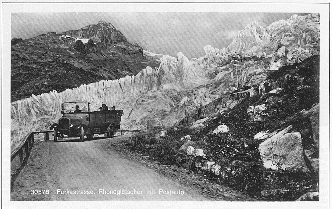
30578 Furkastrasse. Rhonegletscher mit Postauto