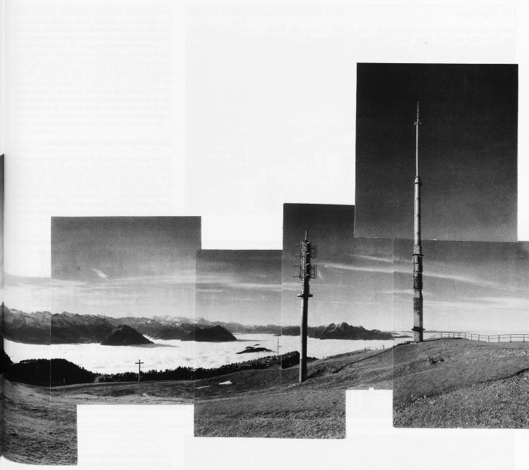
28 Il panorama del Rigi ottenuto mediante il montaggio di numerose singole vedute. Sin dai primi anni dello sviluppo turistico il panorama ha affascinato le generazioni, per cui la sua storia riveste particolare interesse. Le prime notizie sicure riguardanti un panorama circolare risalgono al 1822 e si riferiscono all'opera di Heinrich Keller, disegnatore e uomo d'affari di Zurigo. Questo quadro venne stampato e spedito in ogni parte del mondo, si trattò quindi del primo materiale propagandistico per il Rigi e fece accorrere turisti da numerosi paesi. Il panorama non permetteva peraltro di localizzare chiaramente i punti, in quanto il disegnatore aveva ripreso il paesaggio da un punto girevole con una visione orizzontale.