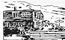
Ski- und Berghaus Casanna Fondei, 7057 Langwies