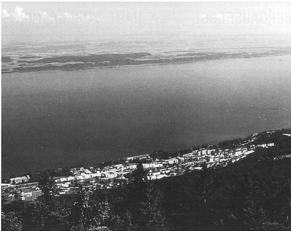
Blick vom Chaumont auf La Coudre am Neuenburgersee

Herbstzeit – Zeit für einen Städtebummel, zum Beispiel durch Neuenburg. Bei schönem Wetter darf dabei ein Ausflug auf den Chaumont, den Neuenburger Aussichtsberg, nicht fehlen. Seit