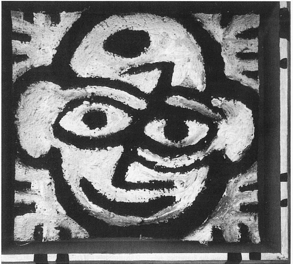
Carlo Domeniconi: Aus der Serie «Ohne Worte», 1987