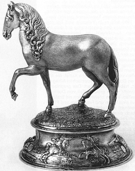
Gefäss in Form eines Pferdes. Silber vergolddet von Hans Peter Oeri, um 1680

Originalmodelle aus seiner Hand erhalten geblieben sind – ein in seiner Art einmaliger Bestand von barocken Goldschmiedemodellen, der sich seit 1910 im Besitz des Schweizerischen Landesmuseums befindet. Die Sonderausstellung be-