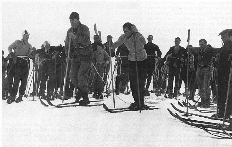
Plausch-Skirennen in Mürren in der ersten Hälfte dieses Jahrhunderts. Beim sogenannten «Challenge Cup» absolvierten zwei mit einem Bergseil verbundene Skifahrer den Parcours. Auf unserem Bild Sir Arnold Lunn am Start – seine «Seilschaft» belegte den zweiten Rang

Der Faltprospekt «Wintersport pauschal 1988/89» kann gratis bei der Schweizerischen Verkehrszentrale (SVZ) Postfach, 8027 Zürich, angefordert werden. Bestellungen bitte mit Postkarte. Viele Pauschalen werden direkt bei den lokalen Verkehrsvereinen gebucht, die – wie die regionalen Verkehrsverbände – gerne Auskunft erteilen.