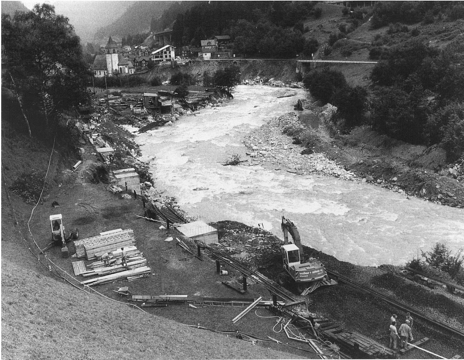
53 Oberhalb der Kirche Gurtellen/Wiler (hinten) baute man nach dem Unwetter eine Hilfsbrücke mit vier Zwischenpfeilern (unser Bild, im Reussbett sind die restlichen alten Gleisstücke zu sehen). Die errichtete Hilfsbrücke wurde später demontiert, nachdem ein neuer Damm aufgeschüttet worden war, der Widerlager und Pfeiler zudeckt