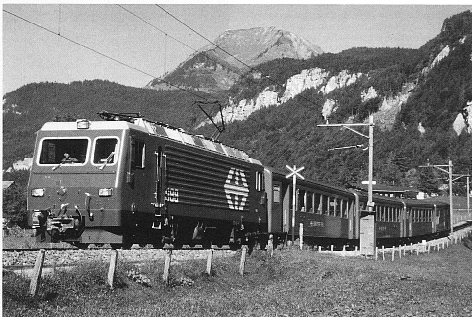
Am 14. Juni 1888 dampfte der erste Zug von Brienz nach Alpnachstad. Die einzige Schmalspurstrecke der SBB feiert diesen Sommer ihren 100. Geburtstag

Am 14. Juni 1888 schliesslich war es soweit: Der Eröffnungszug weihte die gut 45 km lange Strecke ein. Von Brienz dampfte der Zug nach Meiringen, wo bundesrätliche Reden und ein grosser Festumzug auf dem Programm standen. Auf der Nordseite des 1007 m hohen Brünigpasses löste anschliessend eine Feie die andere ab. Ein Jahr später folgte der Anschluss von Alpnachstad nach Luzern. An die Fortführung von Brienz nach Interlaken-Ost wurde erst nach der Verstaatlichung der Brünigbahn 1903 gedacht. Diese Strecke realisierte man im Jahr 1916, mitten im Ersten Weltkrieg.