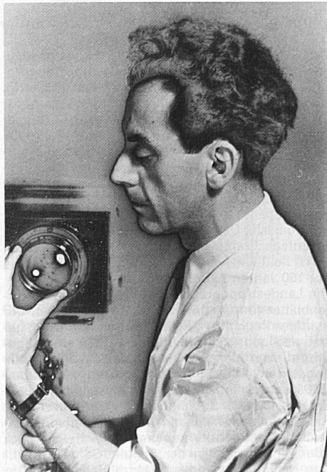
Man Ray: Selbstportrait, 1932