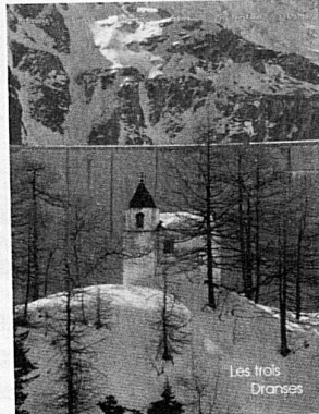
Les trois Dranses