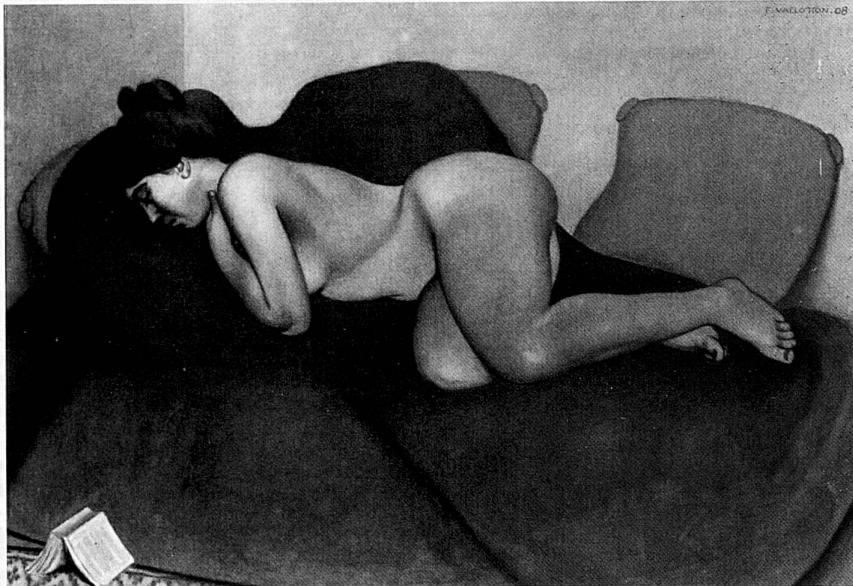
Félix Vallotton, Le sommeil, 1908, Huile sur toile, 114 x 162,5 cm