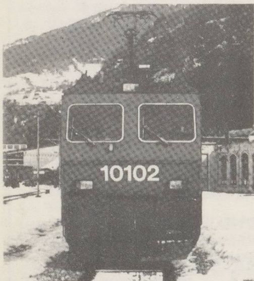
Lokomotiven und Triebwagen der Schweizer Bahnen Band 1: SBB. 1986 Edition. German. SFr 24.80/£11.00

Band 1 Schweizerische Bundesbahnen (SBB)