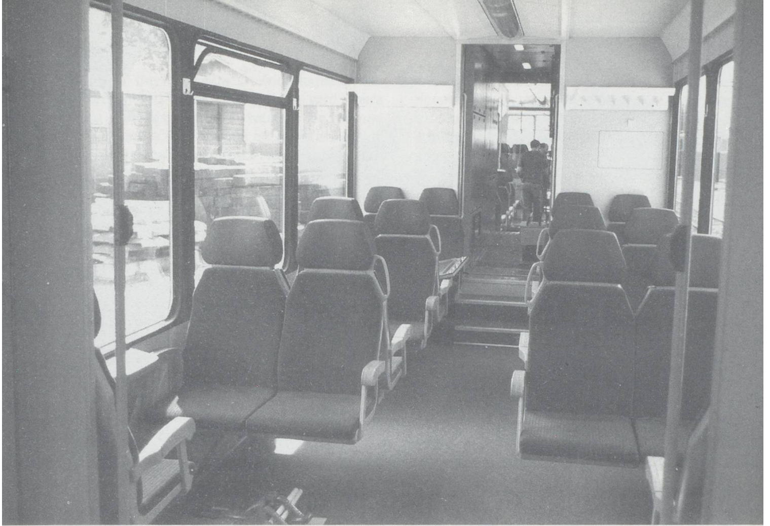
Above: The interior of 7001. The unit is the same as the BTI sets in last months Swiss Express. A central power unit contains all the control equipment, the outer passenger compartments with driving ends rest on the power unit. They are expected to enter service in the spring between Vevey and Montreux. Below: An MOB coach carrying the Crystal Panoramic image.