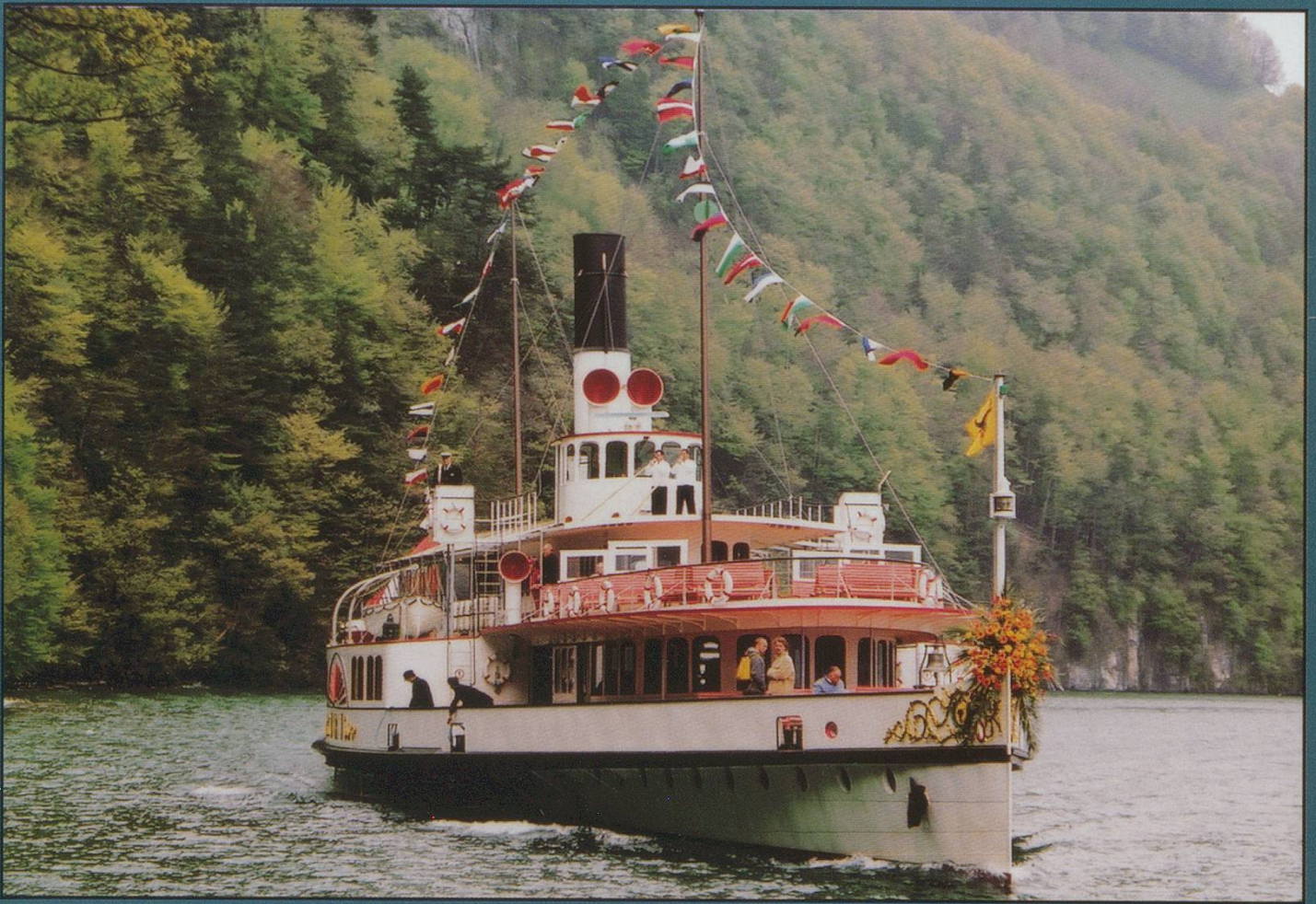
Above: DS Uri glides into Rütli to collect invited guests after the "Weg der Schweiz" celebrations and the day after her 100th birthday. The next Swiss Express will have more about this. 3/5/2001. Below: BLS MS Stadt Thun in her dragon guise glowers into Spiez. 26/5/01. See letter on p52 and make your choice.