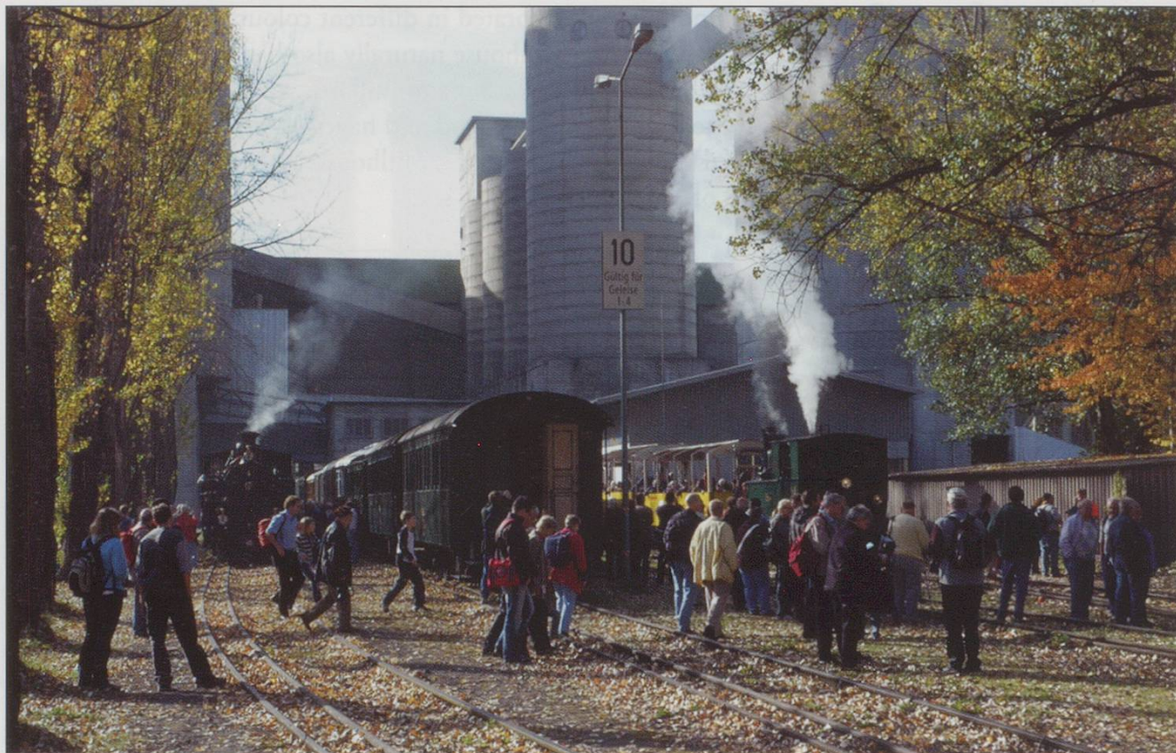
The festival area at the Holcim works.