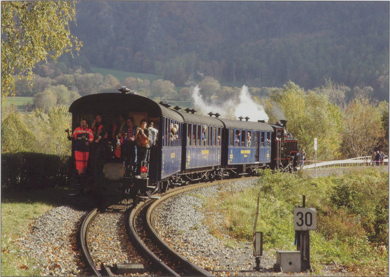
FO 4 on the shuttle train between Untervaz Station and the festival area