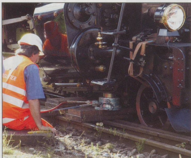
Back on track.