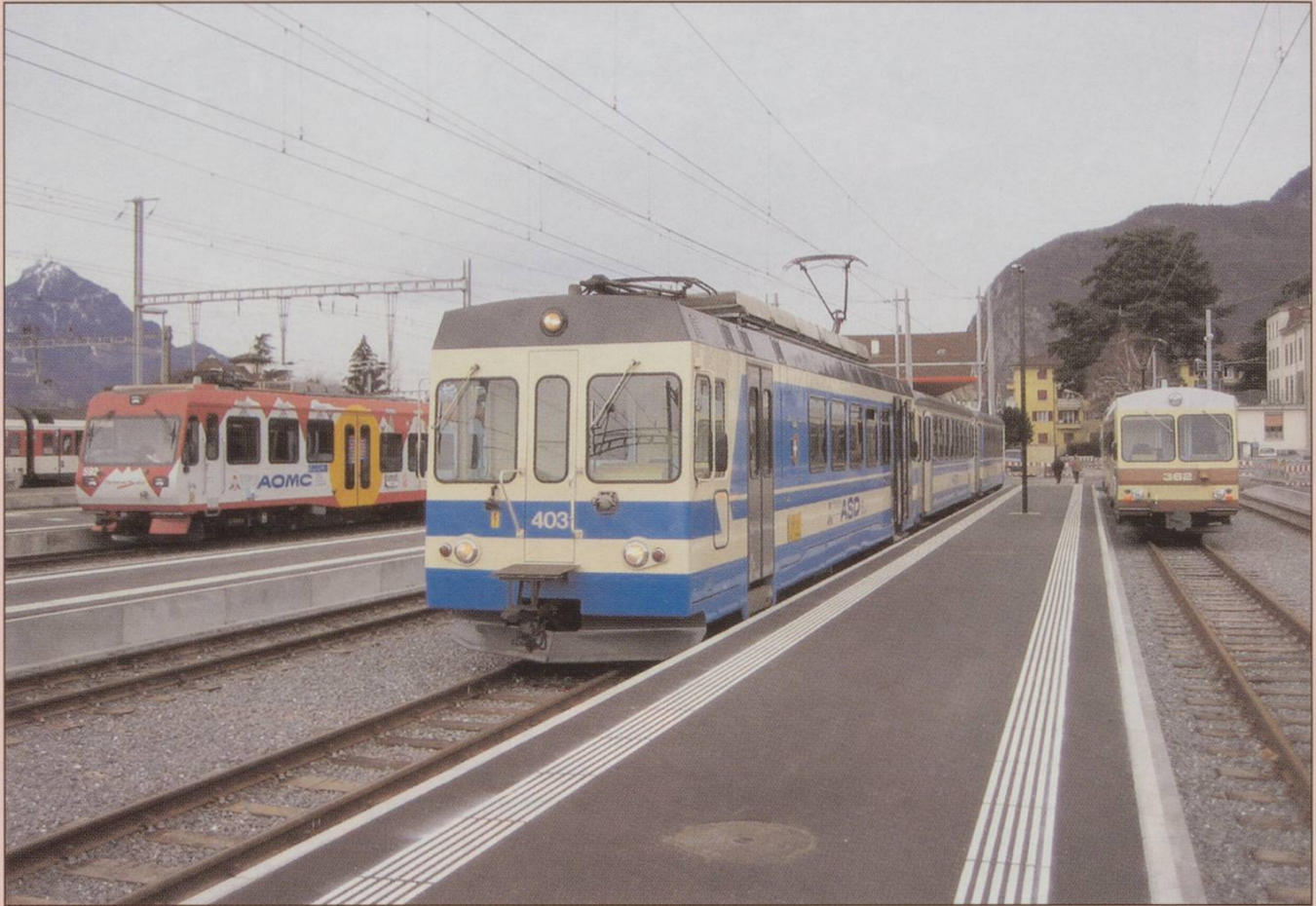
All change at Aigle with the new station forecourt layout.