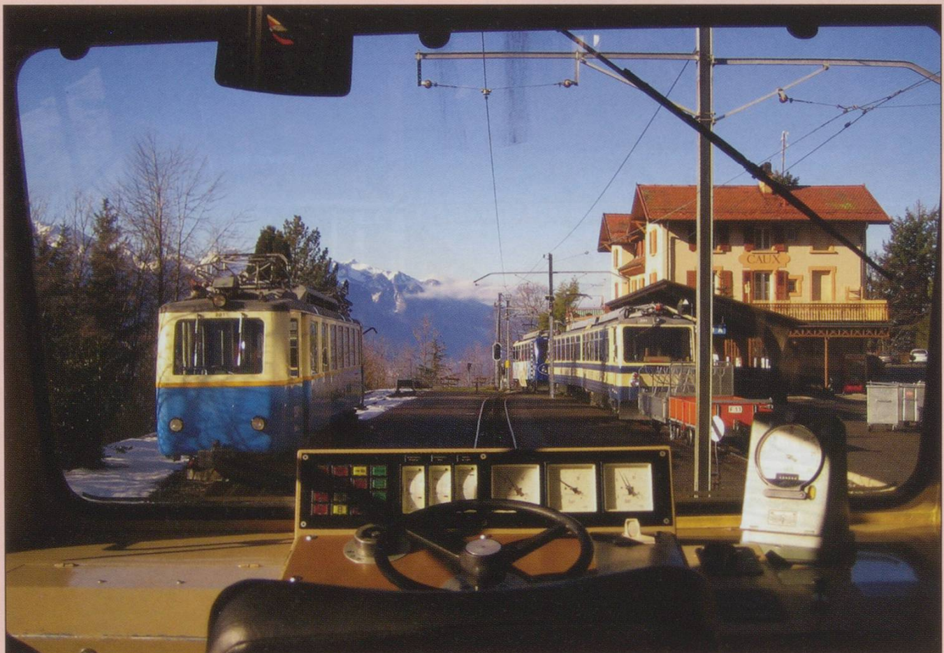
Caux station on 15th February, from the rear cab of Bhe4/8 303.