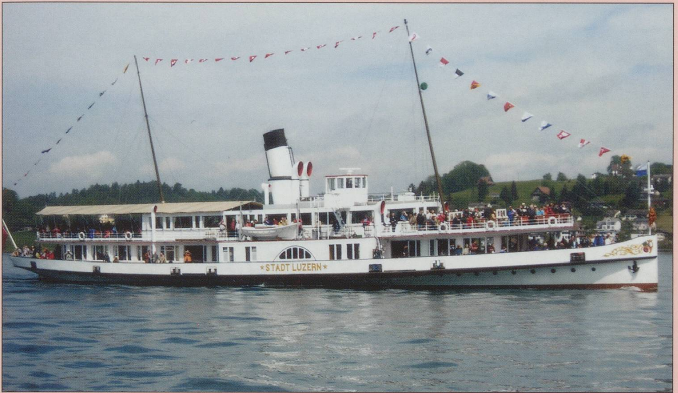
Stadt Luzern 13th May, 2006.