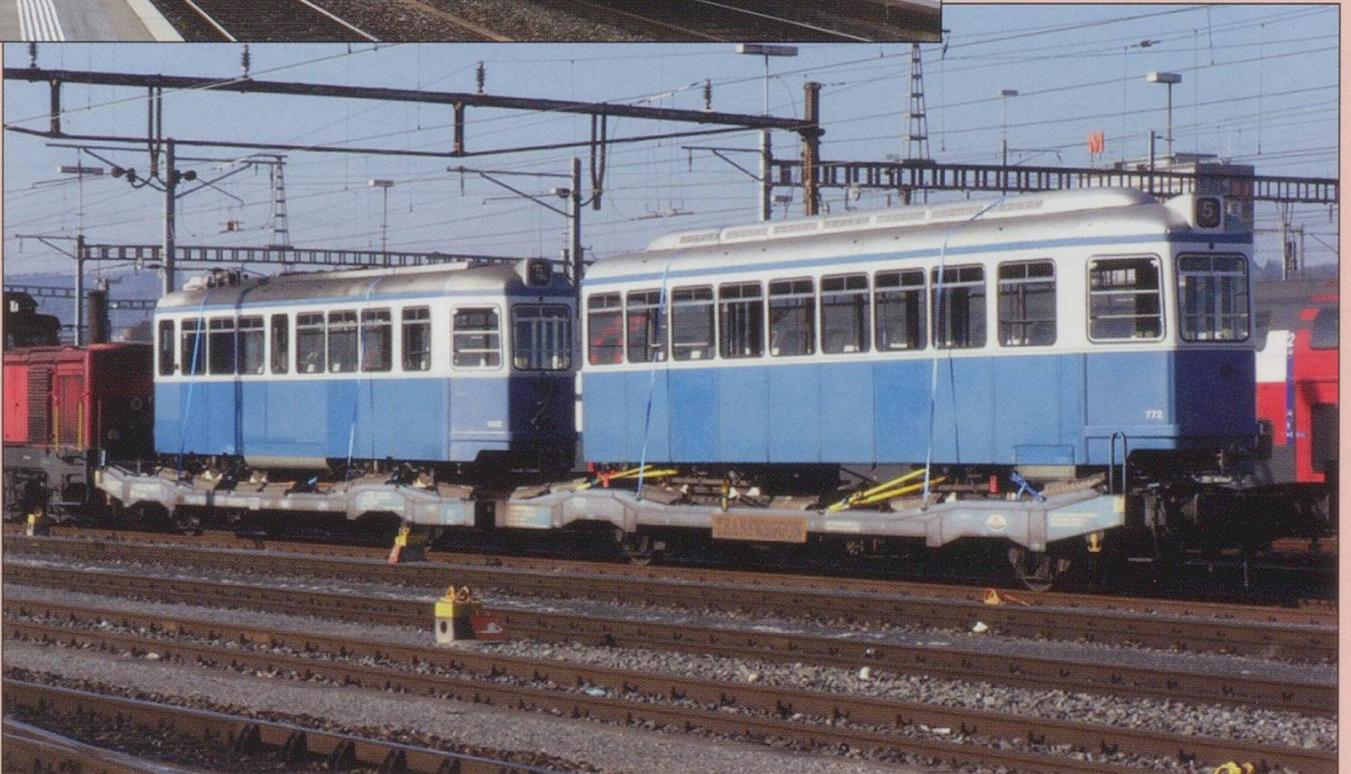
Ex-Zurich trams off to the Ukraine