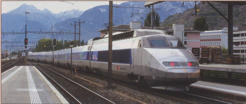
Summer Saturdays Only through Brig to Paris TGV leaving Sion in 16/09/06.