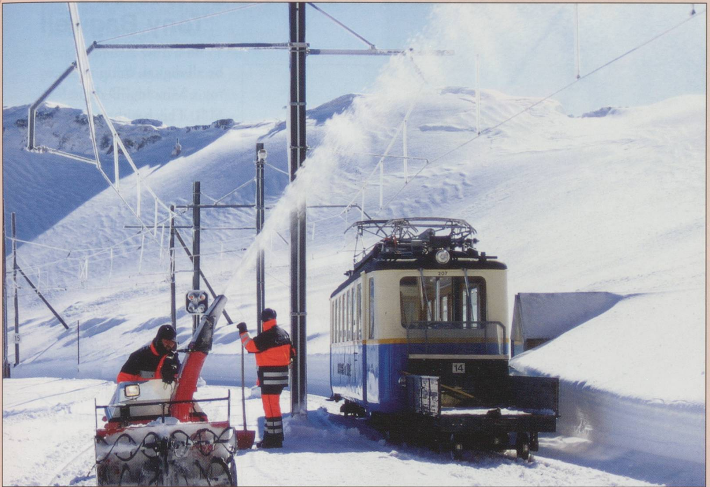
Narrow Gauge winner: John Bennett. Isolated snow shower? Snow clearance at Rochers de Naye on 15th February. Beh 2/4 207 awaits completion.