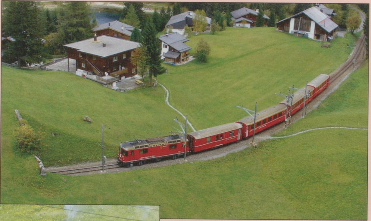
A model or the real thing? Rhb Ge 44ii and train about to enter the last tunnel before reaching Arosa.