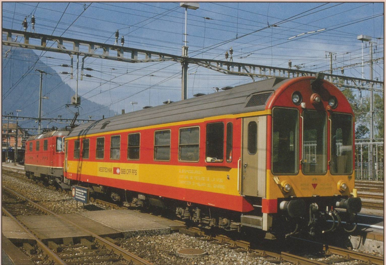
SBB 11271 with "Voiture de la mesure de la voie" X60 85 99 - 73 105 - 6 at Arth Goldau on 17.9.03.