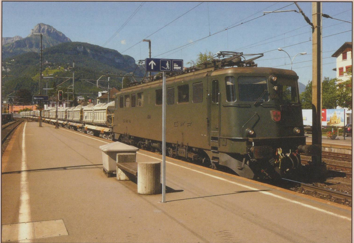
Ae6/6 No 11473 passes through Brunnen in June 2007.