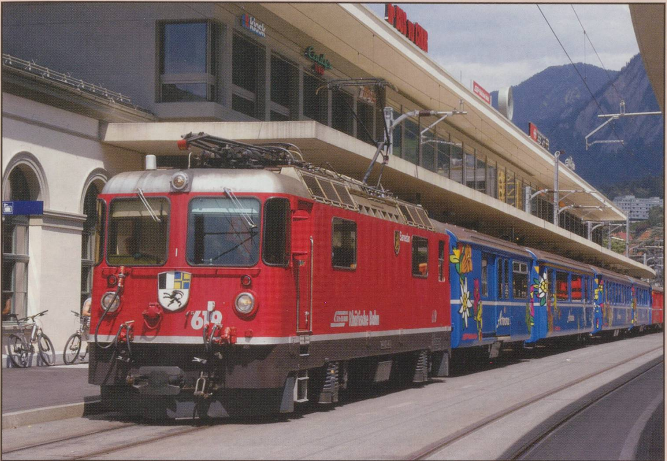
RhB Ge 4/4 n 619 'Samedan' leaving the new Chur station with the Arosa Express, 23.7.07.