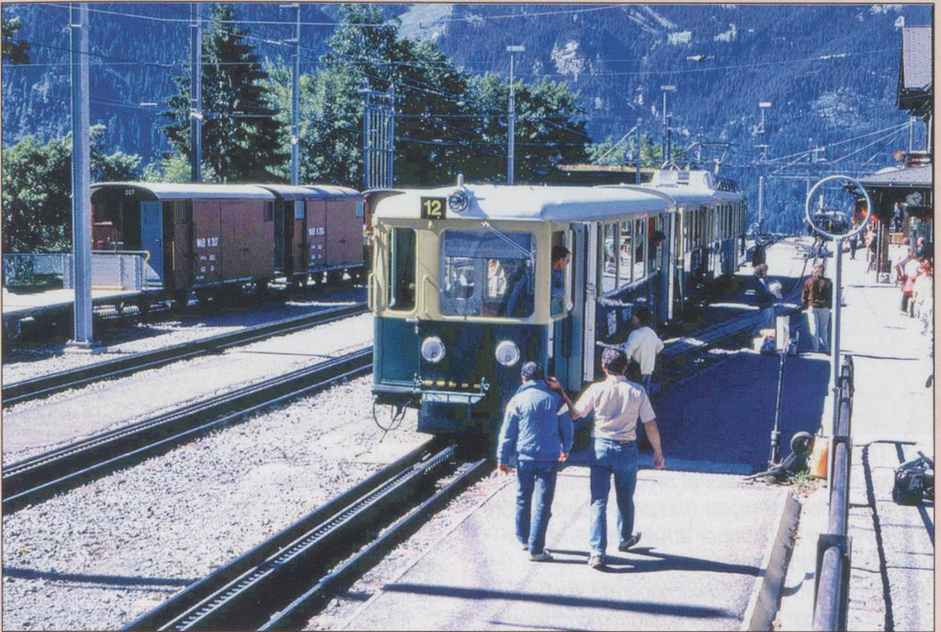
Before the modernisation of the station at Wengen, a WAB unit is seen there in 1985.