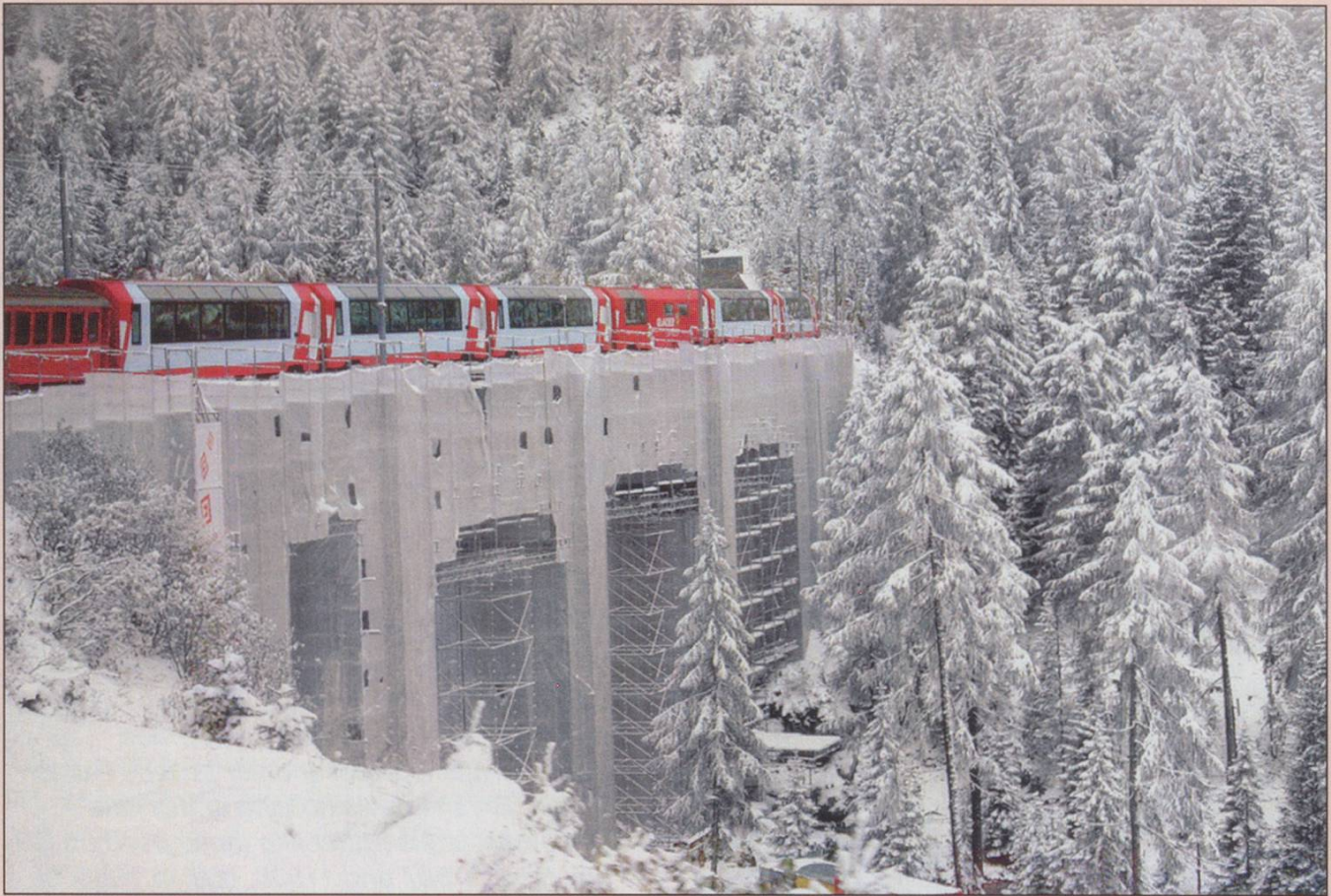
In October, one of the viaducts further up the Albula valley didn't warrant red cladding.