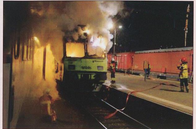
BLS RBDe on fire on 16th December, 2009 at Biel/Bienne. See report on page 40.