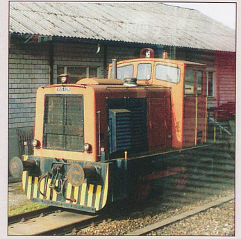
At Flüelen on a private siding (and not accessible) there is this four-wheel, side rod-transmission, diesel shunter built by Ruston in Britain. Bryan knows nothing of this little engine, but it looks rather like those used on BR at one time, 11507 and 11508, built in 1956, of which his ABC tells him they had an 'SLM type friction clutch in a Ruston gearbox'. He wonders if its a cousin of those.