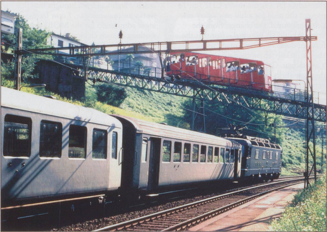
An SBB train with grey coaches passes beneath the S. Salvatore funicular by the main line station of Pardiso at Lugano in 1982. The trains to Gornergrat continue to run even though major engineering work is being done on the parallel track.