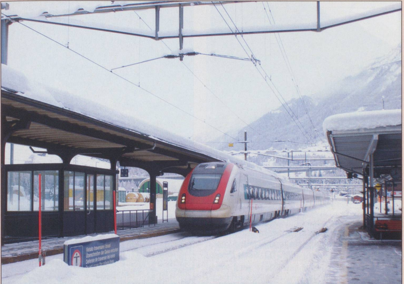
Here is an ICN 500 class just out of the Gotthard Tunnel and passing through Airolo at speed on 22nd December 2009.