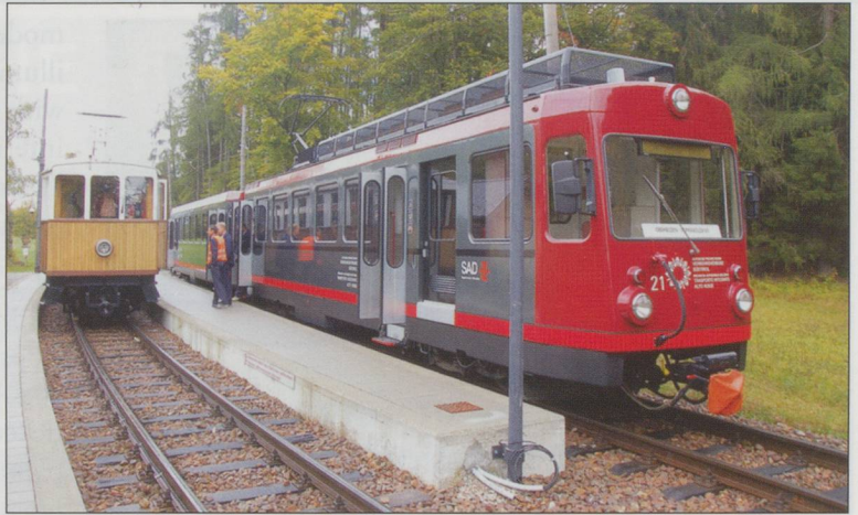
ABOVE: 'Oldtimer' No2 and No21 cross at Lichtenstern - Stella Ritten.