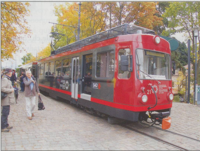
BELOW RIGHT: No21 approaching Wolfsgraben Ritten.