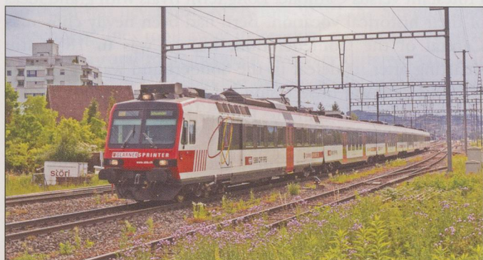
TOP: GL.-Sprinter at Glarus.