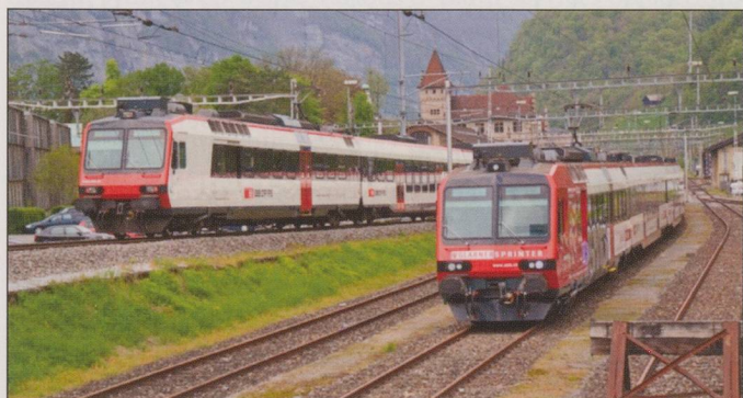
BELOW: Class 514 053-8 on Glarner Sprinter at Schwanden.