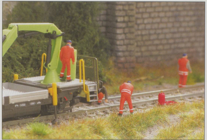
The Kibri unit comes with stabilisers that can be adjusted up and down.