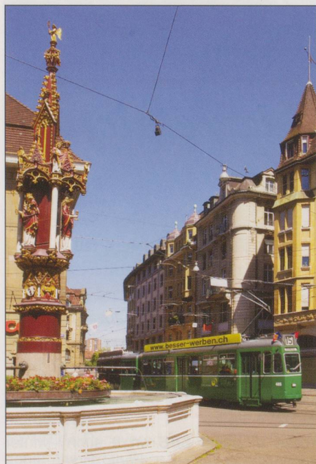
TOP: BVB Swiss Standards 457 + 1473 on Line 15 at Aeshenplatz on 23 May 2014. LEFT: BVB Swiss Standards 465 and trailer and the Fischmarkt fountain on 23 May 2014.