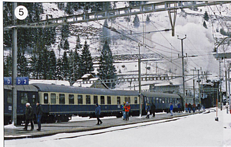
5. Full steam ahead to Gotthard Tunnel of 1882. 6. Emotional and impressive scenery at Wassen.