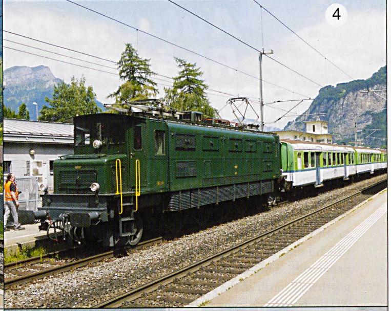
1. Ae6/6 No.11407 at Erstfeld. 2. Something like a word puzzle 'a hot spot' (steam) train on a very cold day gives a cool atmosphere. 3. The steam train with fuel fired 141.R.1244 at the top passing Flüelen, June 27 2015. 4. Ae 4/7 No.10987 with ex-SBB/Ferrovie Nord-coaches ('Leichtstahlwagen', now at Museo verbanco-express Luino) ready at Flüelen for the 'escort train' to Ticino, Saturday June 27.