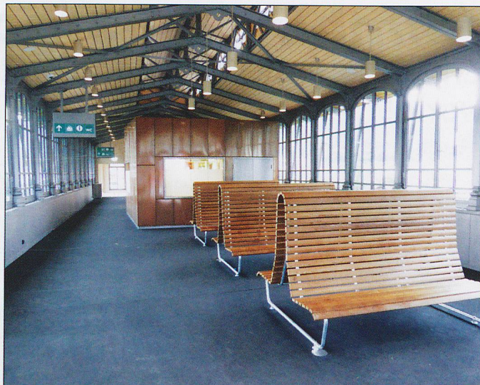
If you have not been to Arth-Goldau in the last few years you will not have seen the rebuilding of the base station for trains to the Rigi. Well this is where you used to board, but the rebuild has put the trains out at the southern end and this is now a very grand station entrance hall. Unfortunately the two new platforms are no longer under cover!!