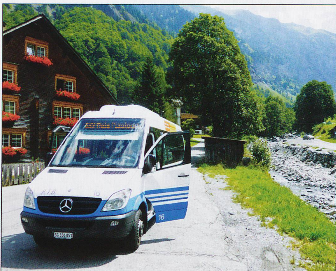
Weisstannen with the hourly service 432 awaiting departure at 13.42 to Sargens.