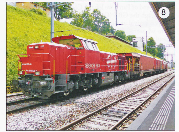
6. Schynige Platte No 5 at Wilderswill being prepared for its run to the summit as part of the 125 year celebrations. 7. New meets old at Aigle BDeH 4/4 301 and a new Stadler unit 543 which has just arrived from Champéry 16/06/17. 8. Class Am 843 843028 is seen at La Chaux-de-Fonds on an 'Extinction' train!! 5 June 2018. 9. This lovely old tram is in Basel. What a great way to see the city. 10. Is the view from Rothorn Kulm on the BRB better than that from Snowdon? Answers NOT required.