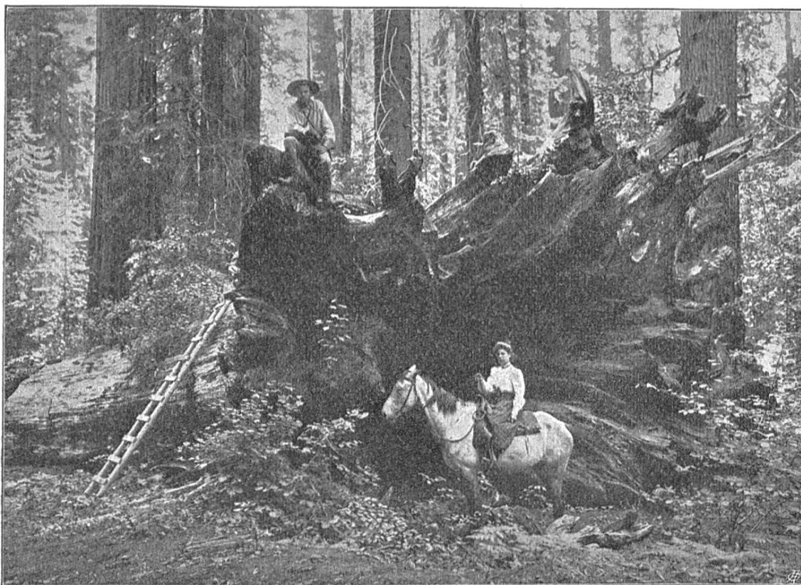
Fig. 1. Souche d'un Wellingtonia, Calaveras Hain, Californie.

Renseignements pris à bonne source, cette information s'est